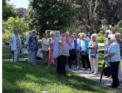
Eindrücke vom Ausflug unserer Senioren